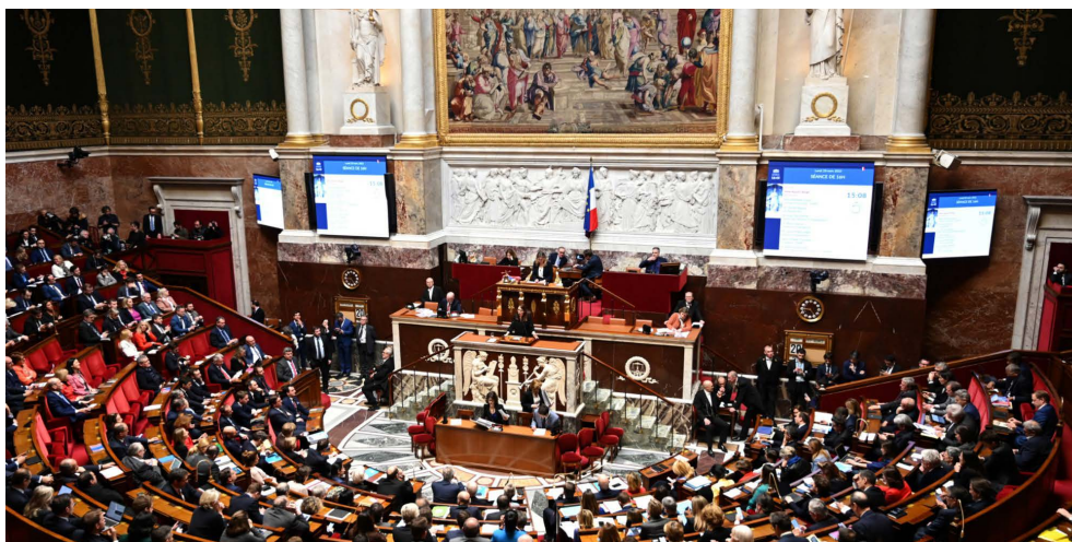
Vote de la loi à l'Assemblée Nationale

Contact : laiciterepubliqueevenements@gmail.com