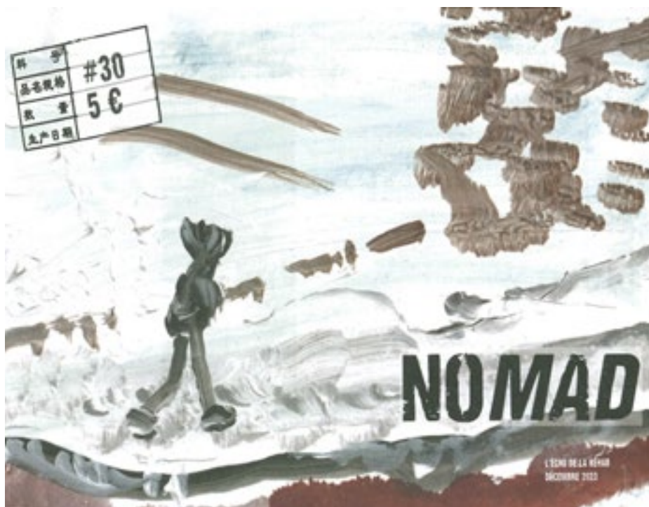
Couverture de NoMad - L'écho de la Réhab

Que dire au poète Que dire au poète Perdu dans les marges Inscrit nulle part S'il ose dire S'il ose écrire Tout redevient possible Que dire au poète Silencieux En attente Prisonnier d'un désir Inachevé Mis en sommeil Que dire au poète S'il contourne les obstacles A marche forcée Peu à peu Une parole émerge Geste imprévu Imprévisible Que dire au poète Prisonnier d'un monde en délire D'un chaos à dire Au centre de l'univers Le poète médite Le poète rêve Il vient d'ailleurs.