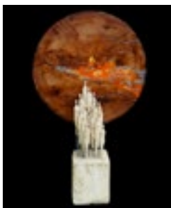
Do Conto - exposition Galerie Envol article page 17