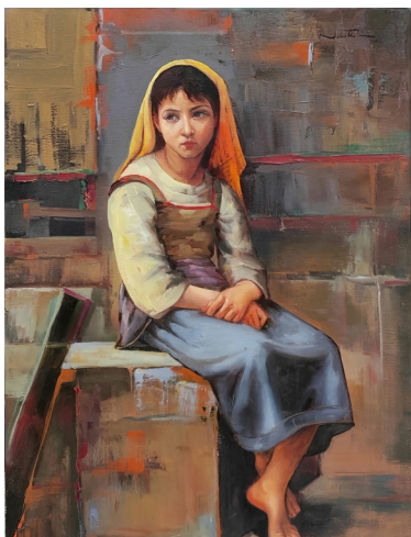
Iran © Shahram Nabati Voir article page 15