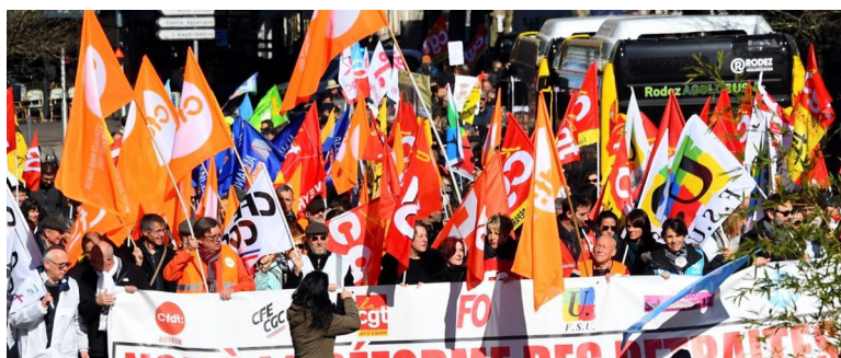
Manifestation le 16 février 2023 à Albi.