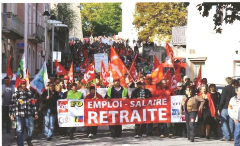
Manifestation contre la réforme des retraites 2010

EXTRAIT DE L'ARTICLE "LA RETRAITE, UNE RÉFORME QUI FÂCHE", ENVOI 604, NOVEMBRE 2010